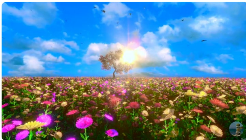
Happy Piano Music 3 Minutes, Piano Music for Good Memories, Beautiful Piano Music, Peaceful Music