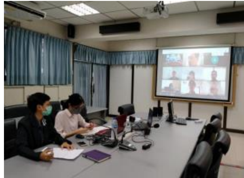
การประชุม Video Conference on to Discuss the Implementation of Activities on ASEAN Health Priority 2: Reduction of Tobacco Consumption & Harmful Use of Alcohol